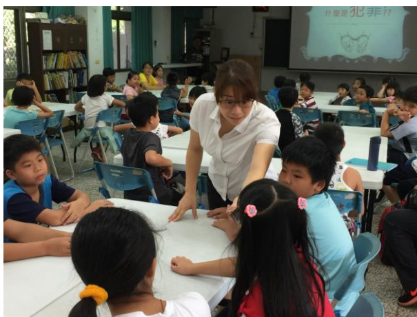
說明：與小朋友進行互動及問答