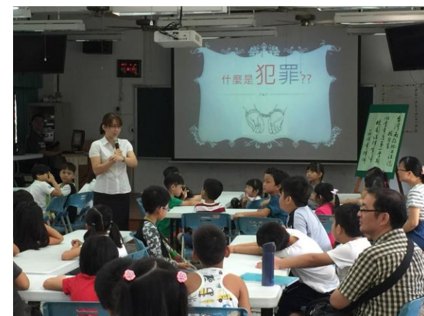
說明：莊律師平易近人小朋友都很喜歡