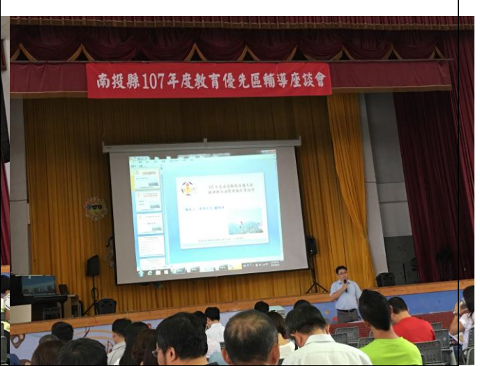
說明：教育處承辦人說明會議流程