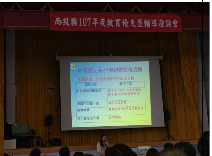
說明：親職講座家長參與低落的原因解析