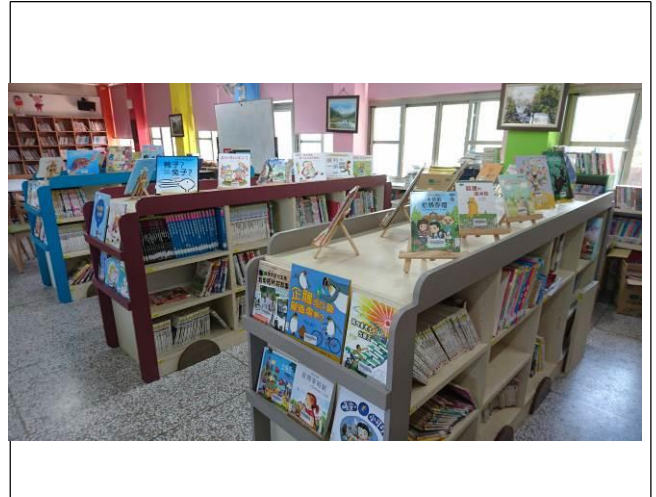
展現書本封面的立體書架