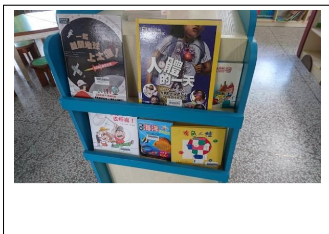
善用邊架展示新書