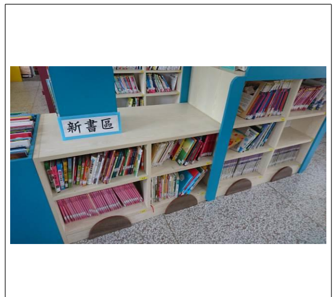
取書方便的新書區