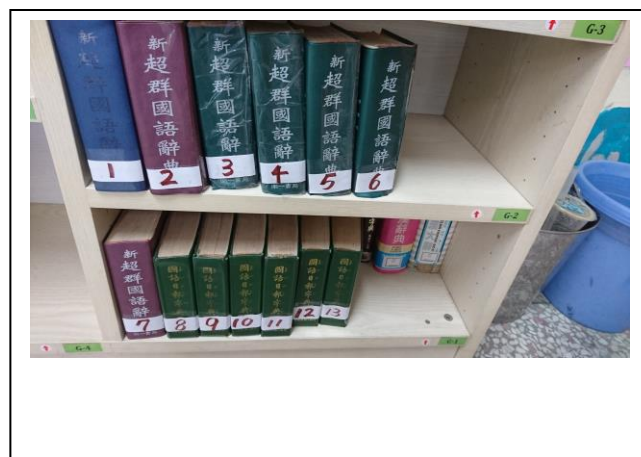
工具書編碼方便取用