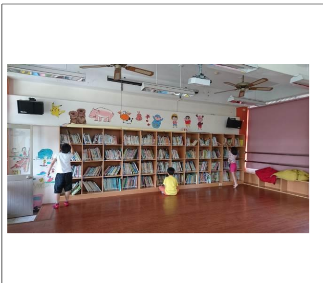
舒適親近的木地板